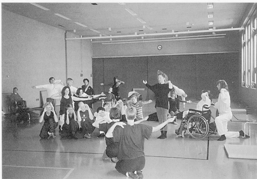
DanceAbility heisst, die persönliche Bewegungssprache und den eigenen künstlerischen Ausdruck im Tanz zu erforschen.

Nater: Eine gute Durchmischung von Menschen mit sichtbarer und solchen mit nicht sichtbarer Behinderung ist von Vorteil. Bisher haben an unseren «BewegGrund»-Kursen keine Menschen mit einer geistigen Behinderung teilgenommen. Natürlich wäre das möglich, man müsste jedoch das Programm anders gestalten und die Themen anders angehen.