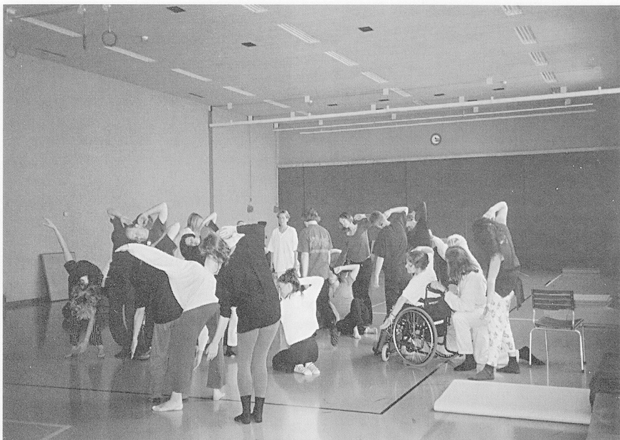
Konzentrierte Arbeit im DanceAbility-Workshop.