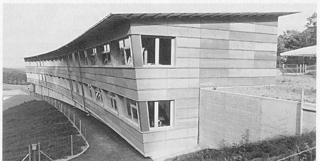
Der elegante Gebäudekörper unterstützt die Qualität der angrenzenden Umgebung.

Die Kinder des Blumenhauses sind starke Persönlichkeiten und voller Gegensätze. Betreuer und Lehrerschaft müssen auf jede Gestik und alle Signale achten, darauf gehen Marianne Flück-Derendinger und René Zäch mit ihren Kunstwerken ein. ■