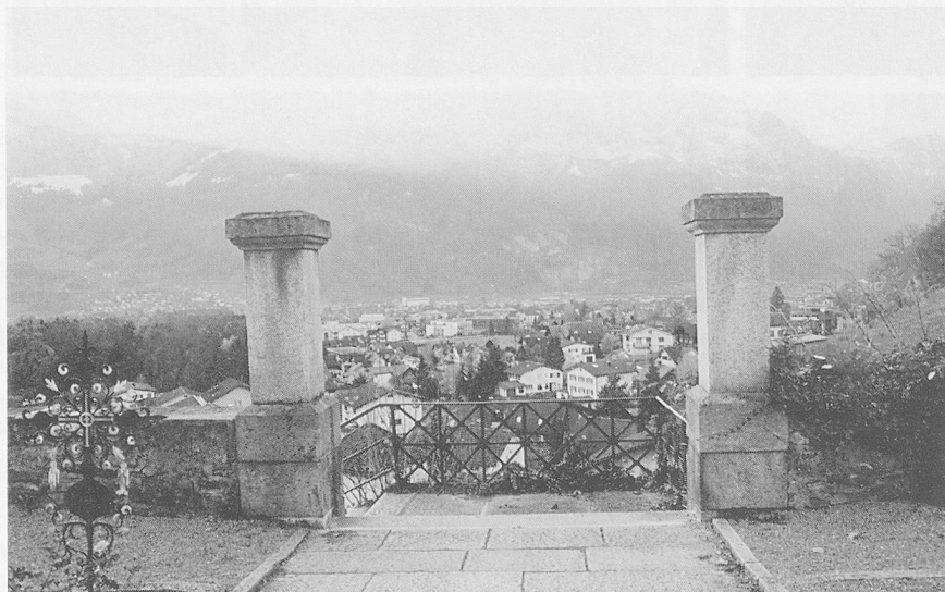
Ausblick, nicht nur aufs Urner Unterland, sondern als Versprechen in die gemeinsame Arbeit der Zukunft.

Die Aktivitäten des HFU umfassten ein Jahrestreffen mit der Trägerschaft und den Heimleitungen. Dort wurde jeweils über die Taxpolitik in den Heimen, das Sozialhilfegesetz, die Krankenkassenbeiträge, die Einführung des BESA-Systems usw. informiert und diskutiert. Und nicht vergessen: Die Heimleitungen