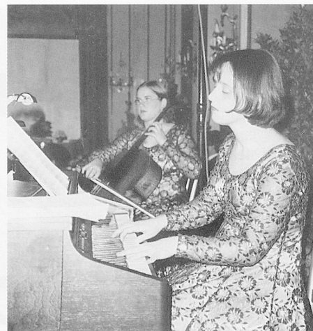
Galaabend im Kursalon Stadtpark: Wien live mit Walzertanz.

2000 als Manager eines sozialen Dienstleistungsunternehmens, in welchem ihm mehr die Rolle des Architekten und Designers, der Lernen im Heim ermöglichen soll, als die des strengen Heimvaters zukommen soll. «Das Heim braucht meines Erachtens vermehrt Führungsgeneralisten mit weiteren Kernfähigkeiten wie etwa Authentizität, Enthusiasmus, Neugierde und Kreativität, der Fähigkeit zu Distanz und Reflexion sowie Zivilcourage.»