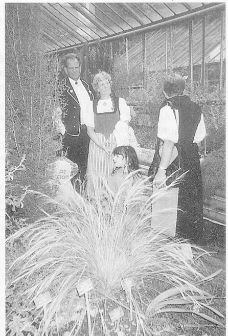
Fremde Pflanzen, fremde Geschichten – Begegnungen sowohl als auch.