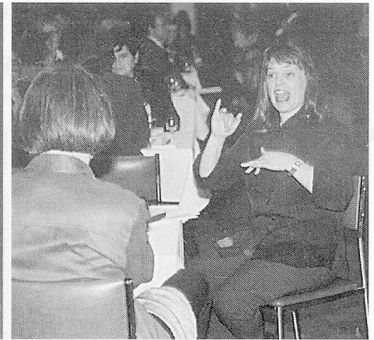
Arbeit und Engagement: Anlässlich der Pressekonferenz; Nationalratspräsidentin Trix Heberlein bei der Eröffnungsansprache und eine unermüdete «Dolmetscherin» für Gehörlose.

die Probleme der anderen Generationen nicht zu vergessen, und, wie Nationalratspräsidentin Trix Heberlein ihrerseits betonte: «Die Gräben sind schon so breit genug, man sollte sie nicht noch weiter öffnen, sondern überbrücken. Mehr Konzilianz statt Kritik.» Die Losung heisse: geben und nehmen.