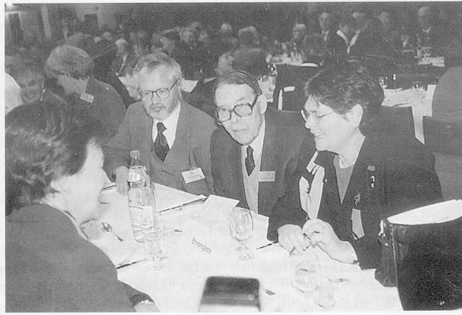
Gäste (links) und Ehrengäste. Bundesratspräsidentin Ruth Dreifuss hielt die Festansprache.