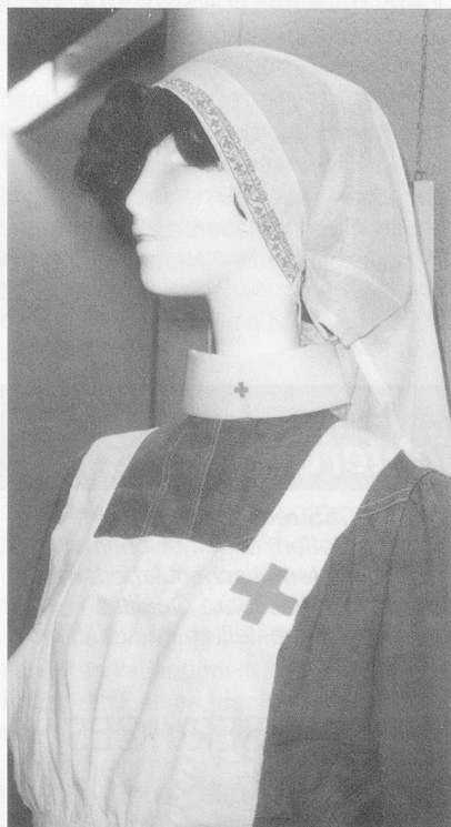
Der Wandel der Pflege macht sich auch an der Berufskleidung bemerkbar: Schwesterntracht um 1900 ...