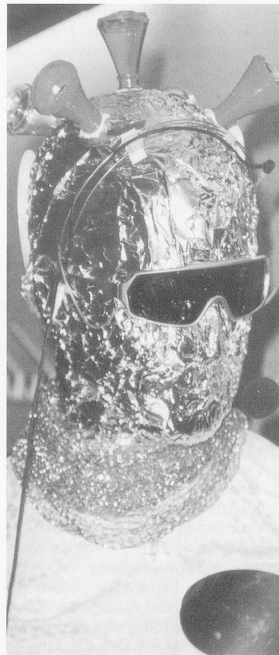
und die Zukunftsaussicht? (Ausstellung anlässlich des Symposiums.)