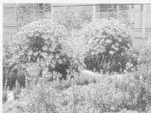
BETHESDA Küsnacht – Heim für Langzeitkranke und Betagte/Physiotherapie.

dort aber keine Arbeitsbewilligung erhalten. Irgendwie bin ich auf die Schweiz aufmerksam geworden. Also bin ich zu Hause auf unser Städtisches Arbeitsamt gegangen und habe nachgefragt, wie ich eine Stelle in der Schweiz erhalten könnte. Zur gleichen Zeit wurden die Stagiaire-Abkommen mit der Schweiz unterzeichnet. So war ich zur rechten Zeit am rechten Ort. Dann ging alles sehr schnell!