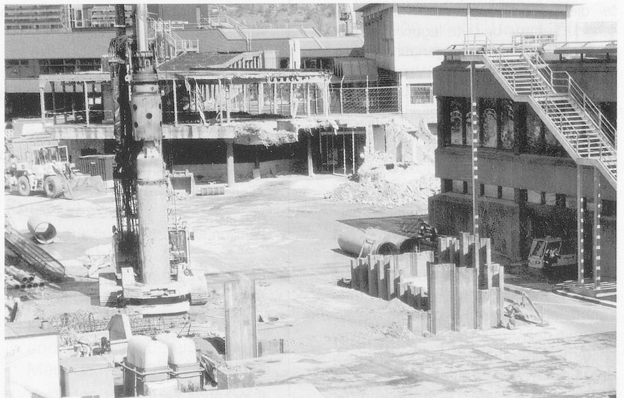
... oder ein Bauplatz, wie der Flughafen Zürich?