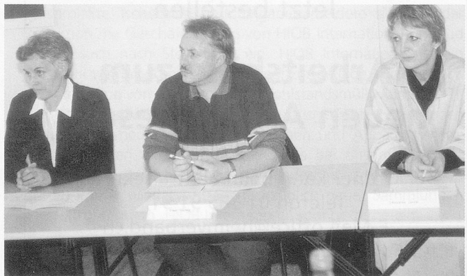
Der Berufsverband: ...