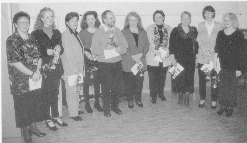
Sie erhielten den Fähigkeitsausweis als Fachpersonen im Bereich Betagtenbetreuung.