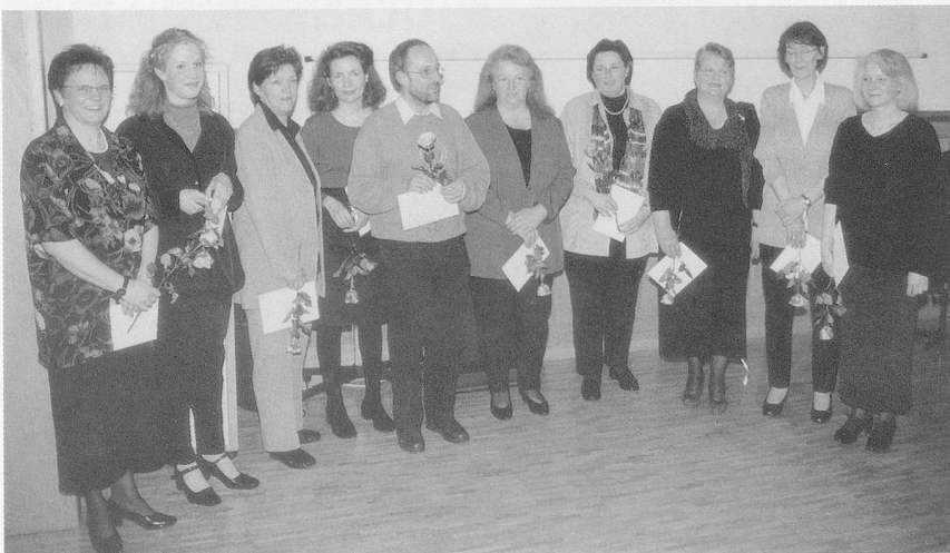
Sie erhielten den Fähigkeitsausweis als Fachpersonen im Bereich Betagtenbetreuung.