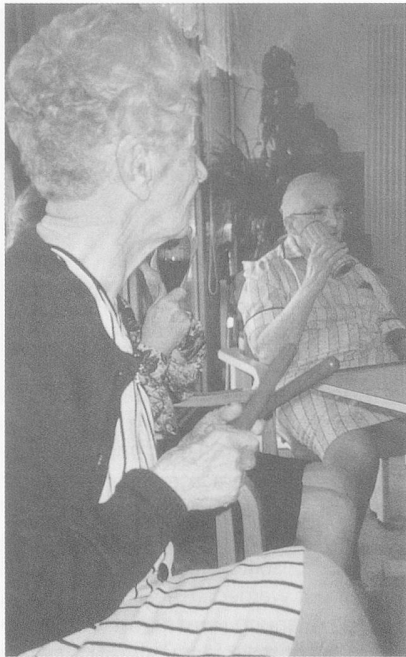
Rhythmus-Instrumente ergänzten die Singstunden.

nen, zu Lebensqualität, Lebenskunst... «...und unversehens sind wir mittendrin in der existentiellen Frage um Lebensqualität und Lebenskunst unserer Bewohner.» Er fand aber auch die Musik, die in der Zeit verläuft, so wie das Leben in der Zeit verläuft. Ordnung, Rhythmus, Harmonie ... Lebens«ordnung», durch den Heimeintritt durcheinander geraten, einen ungeliebten Rhythmus im Heimalltag, disharmonisches oder harmonisches Zusammenleben mit neuen (Zimmer-)Nachbarn, individuelles Erleben in «Dur» und «Moll».