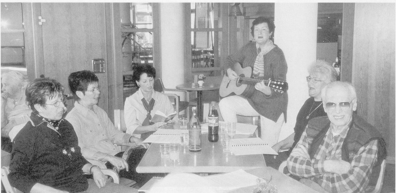
Freiwilligenarbeit im Altersheim Grabs: zum Beispiel die Singgruppe «Stägreiff».

Warum das Ganze? Freiwilligenarbeit soll als Mittel der Öffentlichkeitsarbeit eingesetzt werden: wir wollen das Dorf einbeziehen und das Heim nach aussen öffnen. Schliesslich sollten Heime nichts