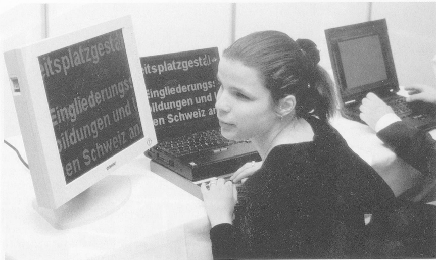
Eine sehbehinderte Frau am Computer, der vorne, zusätzlich zur normalen Tastatur, mit den Zeichen der Blindenschrift versehen ist. Die gewöhnliche Maschinenschrift kann bis 60fach vergrössert werden.

hinderte mehr, als Nichtbehinderte. Weber: «Jeder Mensch soll einen Arbeitsplatz erhalten, der seinen Möglichkeiten entspricht.»