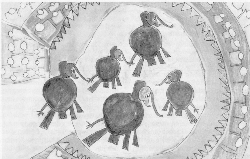
Kunst: «Zirkus», von David Bösch, ein Bild aus dem Kostenangebot der Stiftung Lebenshilfe, Soziales Unternehmen für Menschen mit einer geistigen Behinderung, Reinach.

Die Frage der religiösen Sonntagsgestaltung wird uns im kommenden Jahr sicher weiter beschäftigen. ■