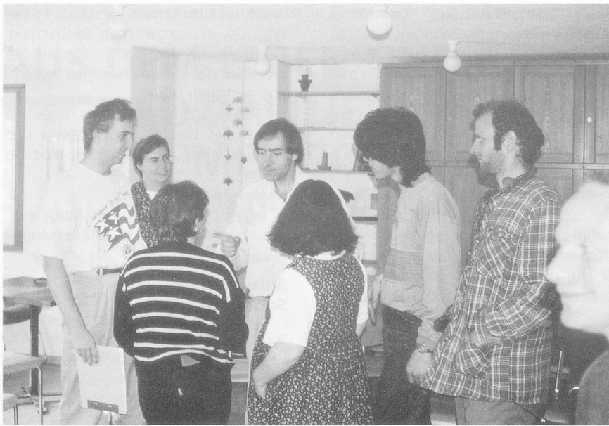
Sprachgestaltung: Mit dem Medium Sprache Kunstwerke schaffen.

chen dem gedanklichen Element des musikalischen Erlebens.