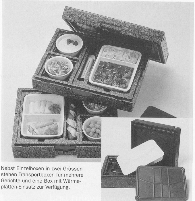
Nebst Einzelboxen in zwei Grössen stehen Transportboxen für mehrere Gerichte und eine Box mit Wärmeplatten-Einsatz zur Verfügung.

Das System für Hauslieferdienste (z.B. Seniorenverpflegung) und Caterer ist in jeder Hinsicht durchdacht: Die Menü- und Beilagenschalen aus Porzellan gibt's in verschiedenen Teilungen und Grössen. Und die Deckel dazu, zur Kennzeichnung des Inhalts, in fünf Farben.