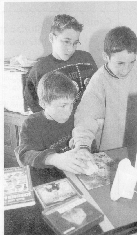
Am Compi: Ob einzeln oder gemeinsam, der Blickwinkel erfasst das eine gemeinsame Zentrum.

Die Welt am Monitor nimmt gefangen, sie erschreckt und tröstet, und sie bindet ein. Eine Phantasiewelt, aber ganz anders als damals, als verkleidet wurde, versteckt, als wir die Regisseure der Spiele waren. Jetzt bestimmt die Maschine das Spiel. Ein Zögern in der Reaktion, ein kurzes Überlegen – und schon ist es zu spät, der Absturz ist einprogrammiert. Nur wer sich voller Konzentration auf das «Spiel» einlässt, der kommt weiter, überlebt, erreicht ein Ziel, welches sofort als Steigerung im Schwierigkeitsgrad neu beginnt. Welche Seele baut da ab oder auf? Wer verar-