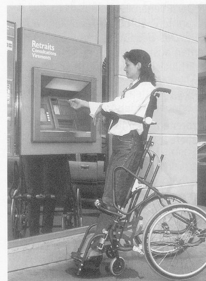
Der Aufrichtrollstuhl Lifestand.*

Sitzbreite 36/40/44/48 cm Sitztiefe 44/56 cm Gesamtgewicht 22/23/24/25 kg