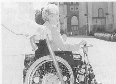
Der Elektroantrieb für Rollstühle e-fix E20.

Der Fortschritt der Technik manifestiert sich vor allem in der Bedienerfreundlichkeit. Als Neuheit bietet der E20 je einen Fahrmodus für den Innen-