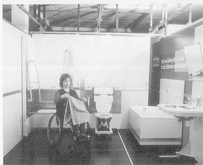
Alle Einrichtungen lassen sich individuell installieren und ausprobieren.*

Die Hilfsmittelausstellung Exma in Oensingen bietet für die Umbauplanung nun eine absolute Neuheit an: Das anpassbare Badezimmer. Wände, Badewanne, Dusche, WC und Lavabo der Installation können so lange verschoben oder entfernt werden, bis man das geplante Badezimmer 1:1 nachgebildet hat. So können Probleme erkannt und beseitigt werden, noch bevor sie zu teuren Fehlplanungen geworden sind.