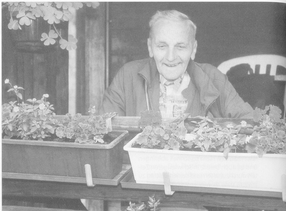
Beständig bleiben: Es war gut so wies war ...

Es sei lediglich als Ratschlag verstanden, nicht bei ersten, ernsthaften Schwierigkeiten die Flucht zu ergreifen in der Erwartung, anderswo und in neuer Beziehung es besser zu haben, noch dazu