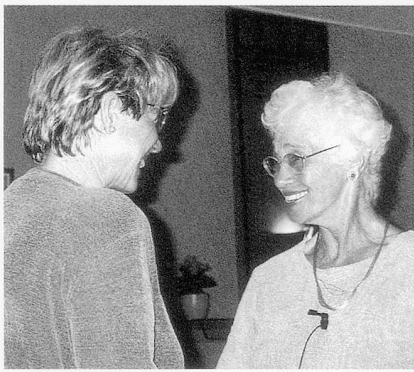
Naomi Feil in einer Trainingssituation

Entwickelt wurde die Validation-Methode von der in München geborenen Amerikanerin Naomi Feil. Entscheidend ist, dass mit dieser Methode, oder eher mit dieser Grundhaltung, nicht versucht wird, den desorientierten Menschen auf die Stufe des Gesunden zu bringen. Validation heisst, auf ihn einzugehen, zu versuchen, ihn zu verstehen, «in seinen Schuhen zu gehen». Dieses Verhalten, so Feil, schafft Vertrauen.