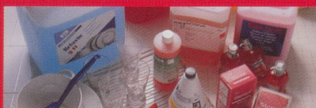
Reinigung und Pflege