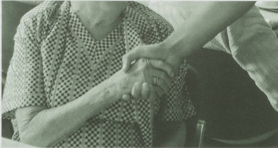
Die Anzahl kranker, alter Menschen wird absolut gesehen ansteigen.

Haushalte stellt sich die Frage nach der Finanzierbarkeit unseres Sozialstaates. Zumal immer weniger berufstätige Menschen in Zukunft für immer mehr Menschen aufkommen müssen, die