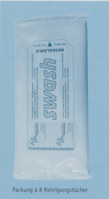
Packung à 8 Reinigungstücher