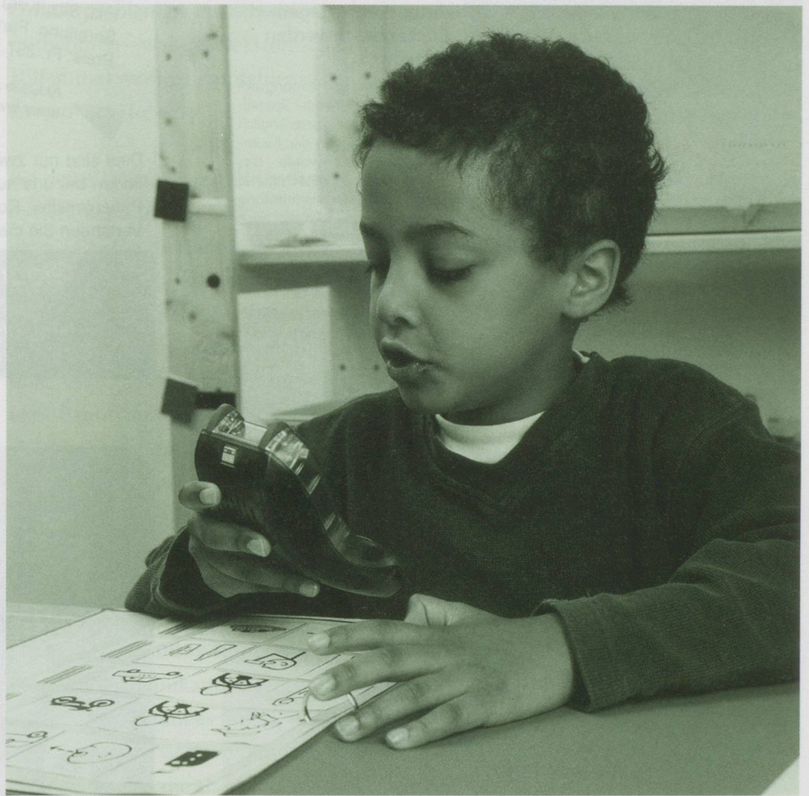
Elektronische Hilfsmittel: Eine genaue, individuelle Abklärung ist bei der Wahl der technischen Hilfsmittel nötig.

«Hector» ist in Sachen elektronischer Kommunikationshilfsmittel quasi die «Erfindung der ersten Stunde» der