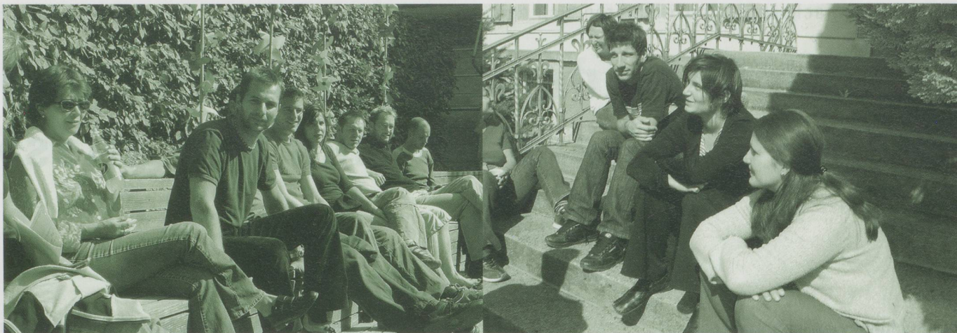
... Schüler/innen der hsl Luzern.

deshalb wissen, wie die drei Stufen voneinander abgegrenzt werden sollen. Der EDK-Vorschlag: Die Soziale Lehre soll zu beruflichem Tun in überschaubaren Problemsituationen befähigen («agir encadré»), die HF zu selbstverantwortlichem Handeln in Situationen von mittlerer bis hoher Komplexität («agir autonome») und die FH zu Handeln in komplexen Situationen mit zu definierenden Problemen sowie zu Forschung/Beratung («agir en expert»).