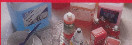
Reinigung und Pflege