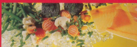
Frisch- und Tiefkühlprodukte