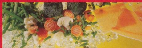
Frisch- und Tiefkühlprodukte