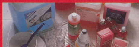
Reinigung und Pflege