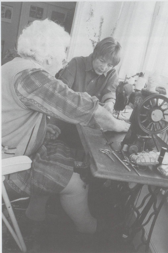
Lebensbegleiterin: Die Nähmaschine, Begleiterin während einem langen, aktiven Frauenleben, kommt auch in der AWA zu Ehren.

In den kleinen Gruppen der Pflegewohnungen – «sieben bis neun Personen sind ideal, auch wirtschaftlich gesehen» – können die individuellen Interessen der BewohnerInnen relativ leicht berücksichtigt werden. «Pflegewohngruppen sind autonome Zellen. Es ist immer jemand da, eine Pflegefachfrau, eine Betagtenbetreuerin, Pflegeassistentin. Oder entsprechend eine männliche Person mit äquivalenter Ausbildung. Eine Putzfrau besorgt das Größte. Die übrige Reinigungsarbeit, Küchen- und Wäschearbeit wird vom Team erledigt. Anschliessend ist jemand für den Abenddienst bis 23 Uhr zuständig, was während der Nacht als Präsenzdienst weitergeführt wird.»