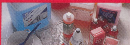
Reinigung und Pflege