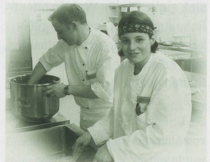
Küchencrew vom Betagtenheim St. Martin

Mocca Fina den seine Gäste besonders schätzen war in der Bewerbung dabei.