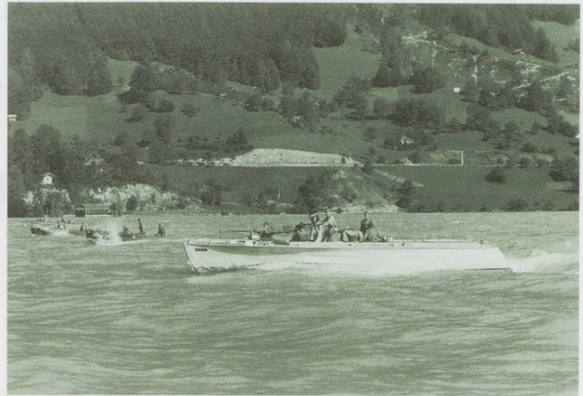
Fahrt in Front

Oder die überraschende Ankunft eines Gauleiters mit Anhang auf dem Seeweg im Morgengrauen. Das beschäftigte den Stützpunkt Güttingen noch eine lange Zeit. Mit einem Mann zur Seite betrat ich das deutsche Boot, vom See her flankiert durch ein P-Boot 41, und erteilte dem SS-Of meine Weisungen. Die Androhung, er würde Schiff und Besatzung in die Luft sprengen, erfolgte; in die Tat umgesetzt wurde