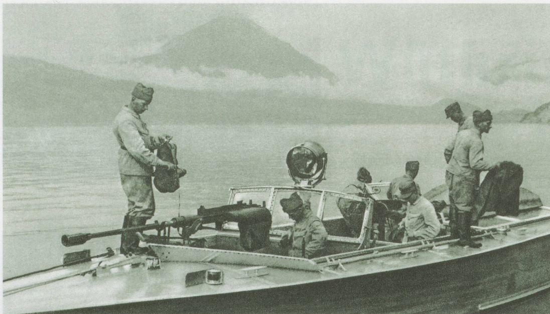
«Bewaffnete Motorboote» mit Mannschaft.

Nebel. Nach und nach habe ich mir auf diese Art, mit diesen Daten, eine Seekarte gezeichnet, die ich allerdings nach Ende des Krieges leider abgeben musste.»