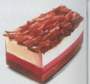
Schwarzwälder Kirsch-Schnitte zuckerfrei