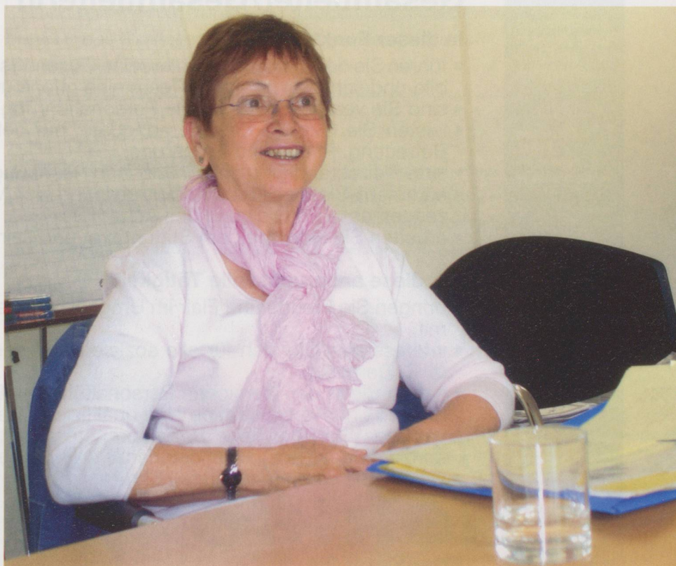
«Es ist wichtig, Abschied zu nehmen».

Kaegi intensiv mit dem Sterben und dem Tod auseinandergesetzt. Dieser habe für sie nichts «Gfürchiges»: «Er gehört, wie schon gesagt, zum Leben.» So breche sie auch nie zu einem Krankenbesuch auf in der Hoffnung, nicht mit einem Todesfall konfrontiert zu werden. Von den Toten verabschieden sich die freiwilligen Sterbebegleiterinnen und -begleiter im Rahmen der Zusammenkünfte mit