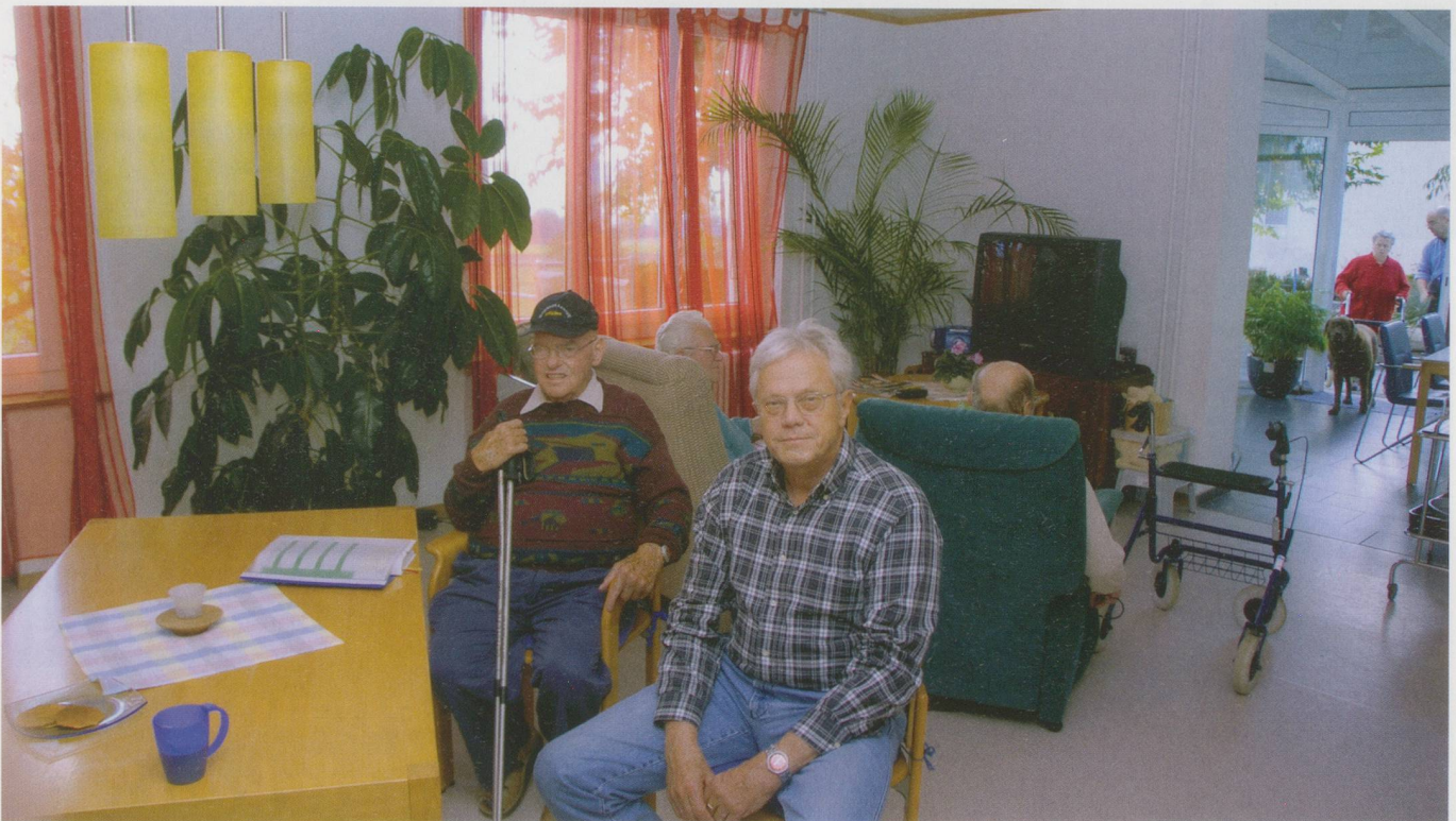
Bewohnerinnen und Bewohner der Tagesstätte «Les Platanes» treffen sich im Gemeinschaftsraum.

des sozialen Umfelds zählen, wie dies auf dem Land der Fall ist. Nicht zuletzt ist das finanzielle Engagement eines Kantons eine Frage der politischen Prioritäten. Diese scheinen in der Romandie stärker auf soziale Fragen ausgerichtet, als dies in der Deutschschweiz der Fall ist. Da das politische Engagement für die Pflegebedürftigen in der Deutschschweiz kleiner ist, wären die Betroffe-