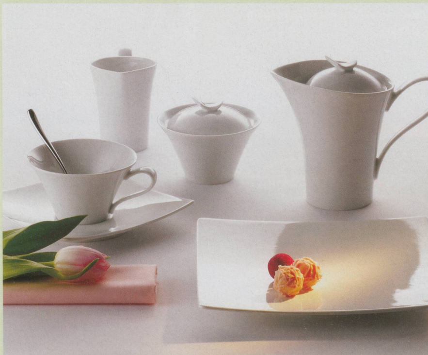
Fine Dining «Edition» von Schönwald