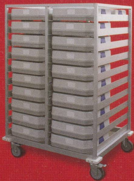
Transportwagen zu Caldo Casa