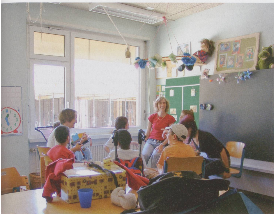
56 Kinder werden im Sonderschulheim Ilgenhalde von 120 Mitarbeitenden betreut und gefördert. Vor den heutigen Klassenzimmern entsteht derzeit das neue Schulgebäude.

Wohnraum für jüngere Behinderte in Oberrieden (ZH) besteht seit 1991 und finanziert sich ausschliesslich durch Spenden. Sie betreibt derzeit zwei Wohnhäuser, eines in Oberrieden und eines in Bülach; eines in Ebertswil ist in Planung. Mit geeigneten Wohn- und Lebensformen will die Stiftung die Lebensqualität für Menschen mit körperlicher Behinderung im Alter zwischen 18 und 55 Jahren fördern und ihnen ein möglichst eigenständiges Leben ermöglichen. Auch das Blindenwohnheim Mühlehalde in Zürich, bekannt für seine Fernseh- und Kinowerbung, ist Zewo-zertifiziert – weist das auf der Homepage aber nicht explizit aus.