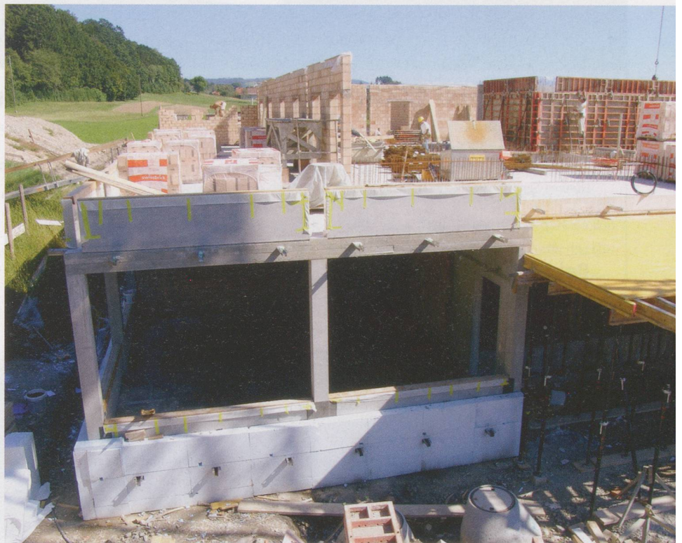
In einem Jahr können die neuen Räumlichkeiten der Ilgenhalde – massgeblich durch Spendengelder mitfinanziert – bezogen werden.

Procap wirbt mit Mailings erfolgreich um Spenden. Über 100 000 Menschen unterstützen den Verband regelmässig, der sich für die Anliegen von Menschen mit Handicap einsetzt. Durch Sammlungen, Spenden und Legate erhielt Procap vergangenes Jahr rund 3,7 Millionen Franken, allerdings schlug auch der damit verbundene Aufwand mit 1,7 Millionen Franken zu Buche. Der Betriebsaufwand betrug