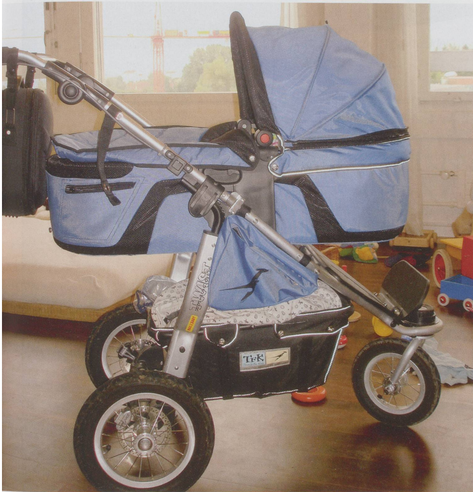
Mit dem Sohn im Kinderwagen unternimmt Zijada Tursunovic – die lieber un fotografiert bleiben wollte – gerne Spaziergänge am See.