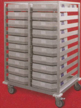
Transportwagen zu Caldo Casa