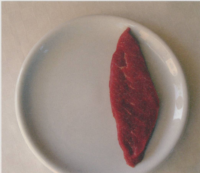
... und 100 bis 120 g Fleisch.