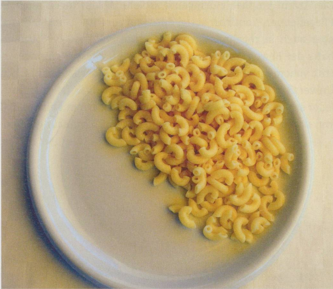
So viel müssten Betagte zu Mittag essen: 180 g Teigwaren ...