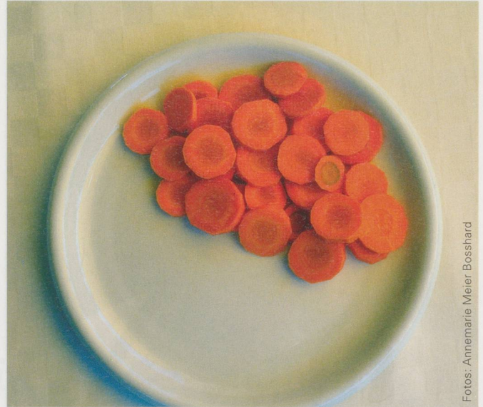
... 120 g Gemüse ...