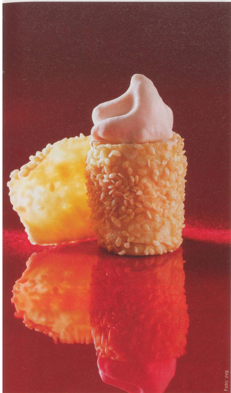
Zur Molekularküche gehören Schäume aller Art – hier in einem Rezept, das «Cranberry-Espuma auf Pouletpapier» heisst.