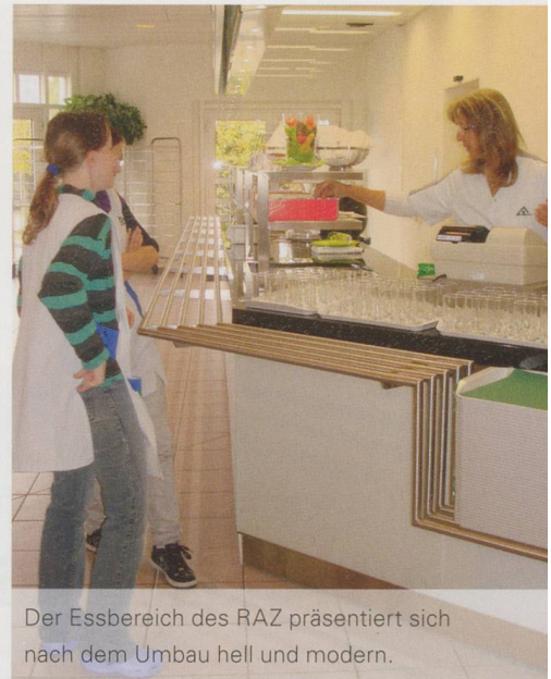
Der Essbereich des RAZ präsentiert sich nach dem Umbau hell und modern.

geistigen Behinderung müsse man etwas vielleicht mehrfach erklären, aber dann klappe es. Menschen mit psychischer Behinderung seien weit weniger stabil, so Brugger. «Da kann eine Mitarbeiterin beispielsweise am Morgen bestens gelaunt zur Arbeit erscheinen und rastet dann zwei Stunden später wegen irgendeiner Kleinigkeit komplett aus.» Solche Situationen seien für das Umfeld nicht immer einfach und erforderten von den Verantwortlichen viel Geschick.