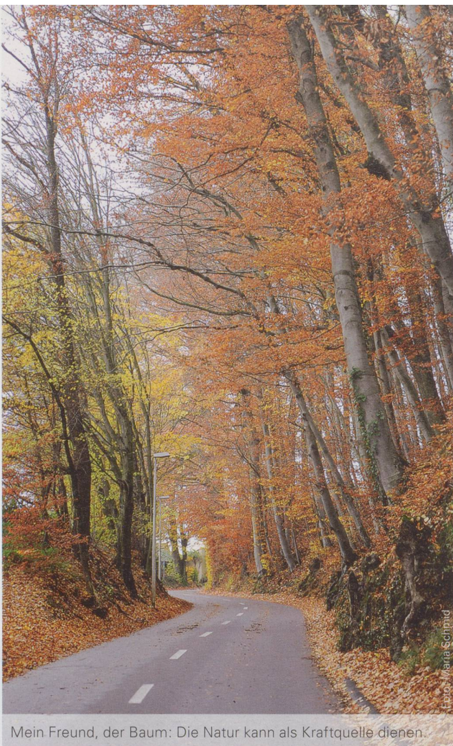
Mein Freund, der Baum: Die Natur kann als Kraftquelle dienen.

Dimension sei nicht fakultative Ergänzung, sondern Teil des Pflege-Auftrags. Professionelle Pflege nehme neben physischen, psychischen und sozialen auch spirituelle und geistige Bedürfnisse von betreuten Menschen wahr und suche Wege, um diesen gerecht zu werden – so definierte es etwa die Schweizerische Akademie der Medizinischen Wissenschaften 2001 im Rahmen des Projekts «Zukunft Medizin Schweiz». Spiritualität sei zudem eine Ressource für die Pflegenden selber, bekräftigt Heitlinger. Sie biete ihnen Unterstützung, um ihre grosse Verantwortung trotz Stress und Zeitdruck menschengerecht zu tragen: «Spiritualität ist eine Burnout-Prophylaxe.» Können denn auch junge Pflegenden etwas damit anfangen? Anfängliche Skepsis weiche oft einer grossen Offenheit für das Thema, stellt Heitlinger als Ausbildungsverantwortliche fest. Junge Pflegenden seien beeindruckt, zu sehen, wie alte Menschen in der Spiritualität oder im Glauben Kraft fänden. Sie könnten dabei fürs eigene Leben lernen. Den intergenerativen Austausch in der Langzeitpflege hält Heitlinger für einen sehr wichtigen, noch differenzierter zu fördernden und zu gestaltenden Aspekt.