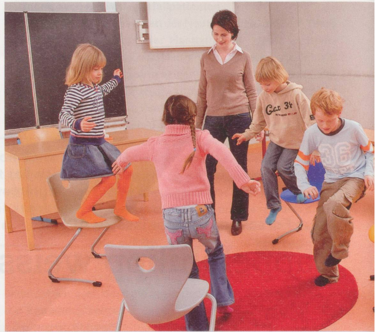
Warum so zappelig? Berner Forschende untersuchten die Hirnströme von Kindern mit und ohne ADHS.