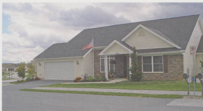
Das Sternenbanner darf nicht fehlen: Solche Einfamilienhäuser beziehen die Seniorinnen und Senioren, wenn sie in die Alters-Community der Asbury-Stiftung eintreten.

Die Grösse der Communities ermögliche viele Angebote für die Bewohner, von der Kultur über Wellness bis zu diversen Therapien, konstatiert Heimleiter Isler: «Das wäre in der Schweiz so gar nicht möglich oder nur in sehr grossen Heimen.» Auf der eigentlichen Pflegeabteilung in der US-Community hingegen gehe es ähnlich zu und her wie in Schweizer Heimen. Qualifiziertes Pflegepersonal sei auch in den USA Mangelware. Für Pflege und Betreuung gälten die gleichen Qualitätsindikatoren, allerdings seien die Benchmark-Resultate für