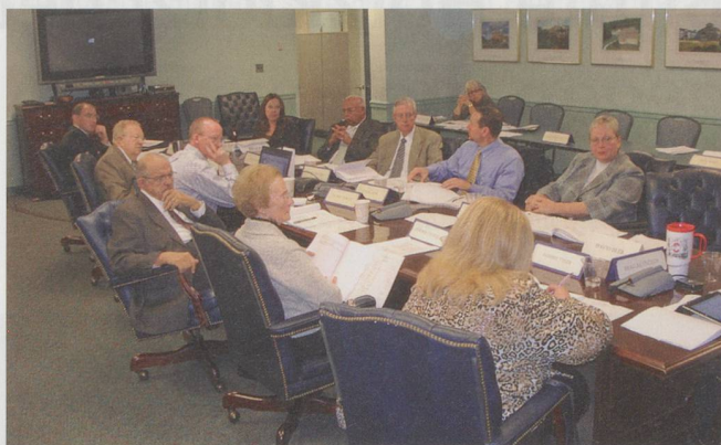
Budgetsitzung der Asbury-Stiftung: An der linken Tischseite haben eine Bewohnerin (2. v. r.) und zwei Bewohner (3. und 5. v. r.) Platz genommen. Sie reden mit, wenn es um Tarife geht.

Fundraising-Manager treiben jährlich bis zu vier Millionen Dollar Spendengelder ein.