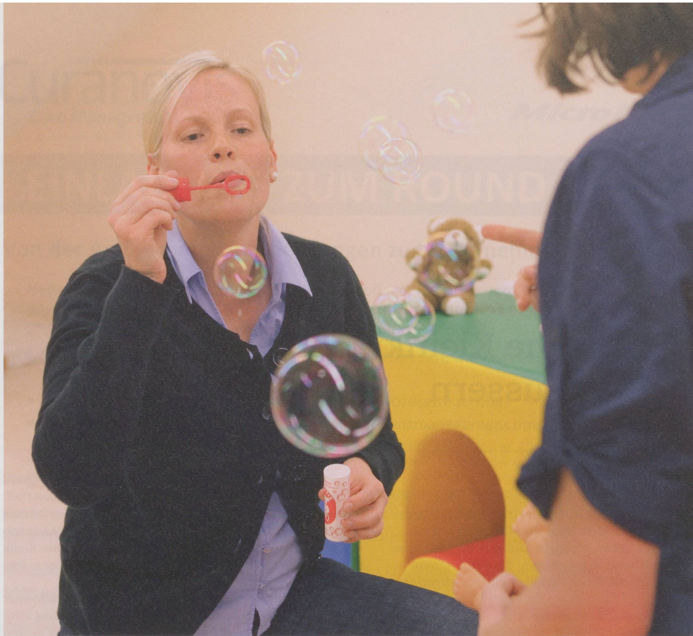
Kontaktaufnahme mit Seifenblasen: Während des Spiels stehen Kind und Spielpartner unter therapeutischer Beobachtung.