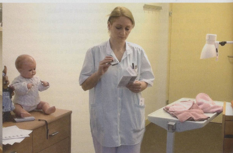
Nach jeder Verrichtung zieht die Mitarbeiterin den Scanner, den Bewohner- und den Leistungskatalog aus der Tasche ...