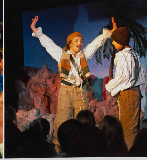
Kein Wunder: Hier gilt es, Abenteuer auf der Schatzinsel zu bestehen.