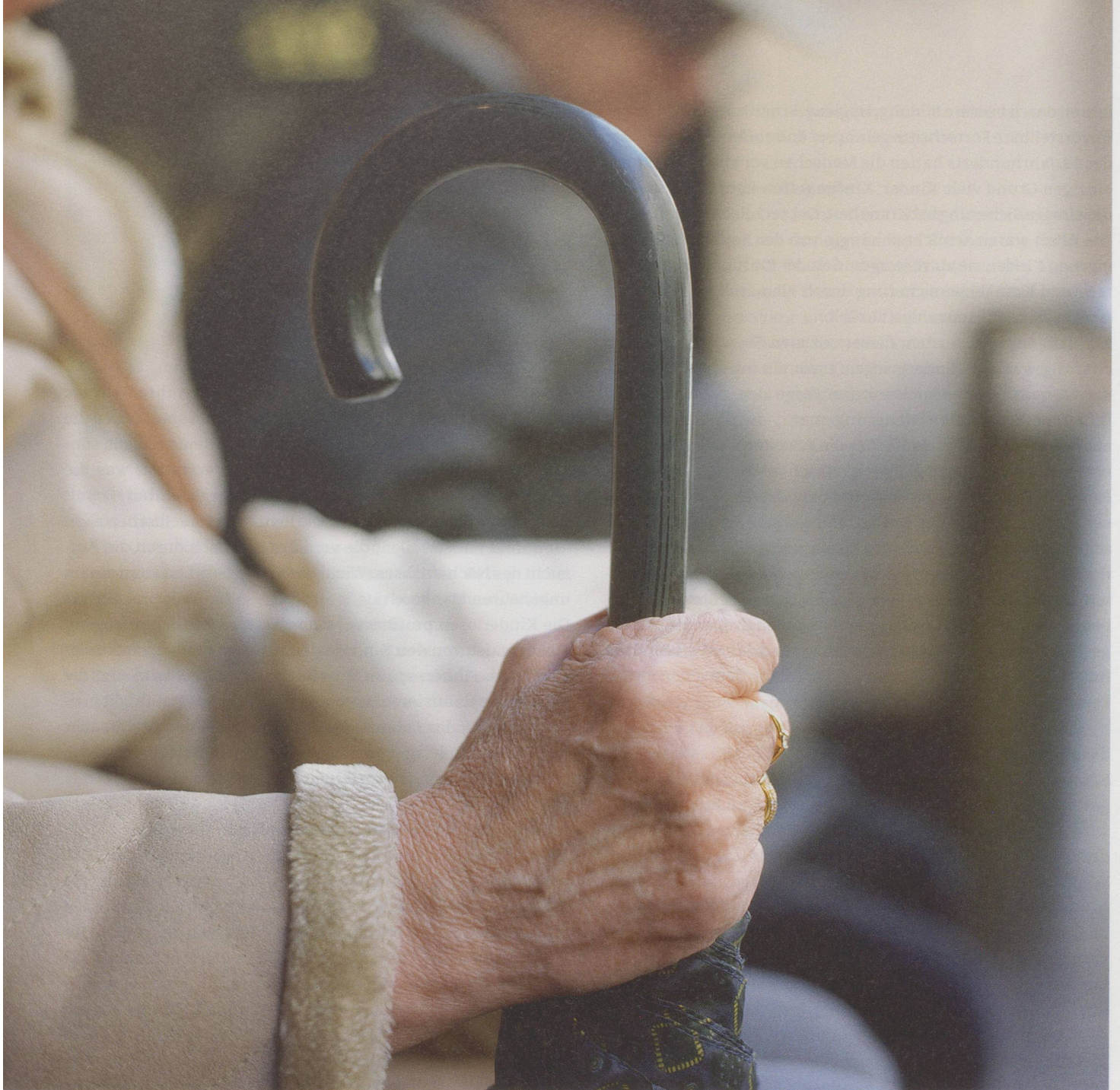
Die Lebenserwartung steigt täglich um vier Stunden – eine irre Entwicklung.