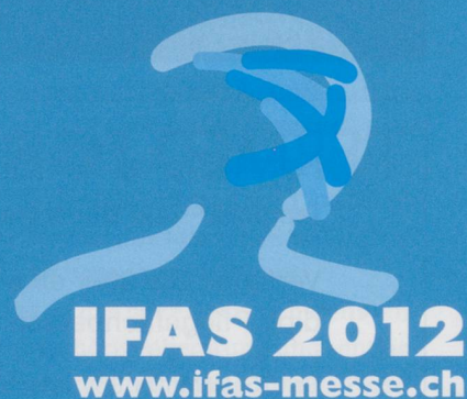
Exhibit & More AG · Bruggacherstrasse 26 · Postfach 185 · CH-8117 Fällanden-Zürich/Schweiz T +41 (0)44 806 33 77 · F +41 (0)44 806 33 43 · info@ifas-messe.ch · www.ifas-messe.ch

WIR HELFEN HEILEN FAS MED Schweizerische Medizintechnik Suisse Medical Device Technology Technologie Médicale Suisse