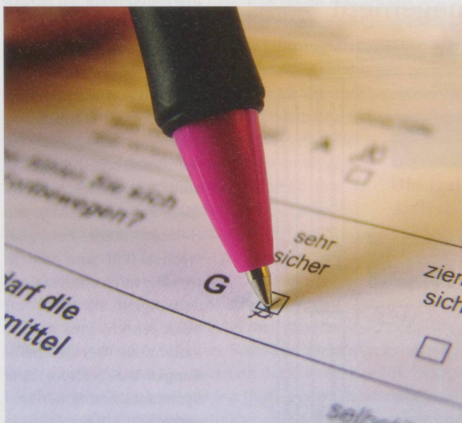
Ob, wie hier, auf Papier oder elektronisch: Formulare, Dokumentationen und Berichte prägen den Heimalltag.

Die Kosten pro Pfl egetag (bereinigt um die Teuerung und die Zunahme der Pflegeintensität) nahmen in den Jahren 2003 bis 2010 um sechs bis neun Prozent zu. Diese Kostensteigerung ist ein Hinweis darauf, dass zusätzlicher Aufwand entstand – und zwar unabhängig von der Zunahme der Pflegeintensität und der Teuerung. Die Annahme liegt nahe, dass der zusätzliche Aufwand vorab bei administrativen Arbeiten angefallen