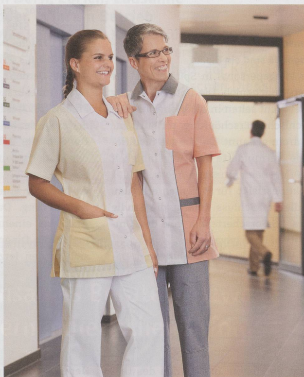
Berufskleider für Spital und Heim aus dem Hause Wimo AG sind ein Begriff für «Swissness».